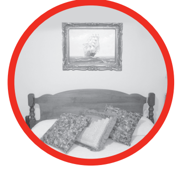
កុំដាក់កញ្ចក់បិទថត និង កញ្ចក់ផ្ទះ មុខ នៅលើក្បាលដំណេកឱ្យសោះ។