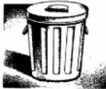
ធុងសំរឹមដែលមានគ្រប