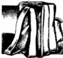
ធុងស្បាយពីក្រោយខ្លួនសំរាប់ដាក់ឥដ្ឋដើរច្រា