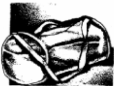
ប្រអប់យូរដៃ។